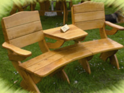
Neu! Tischbank - gerade oder im Bogen aus 3 cm Eiche: 580 Euro