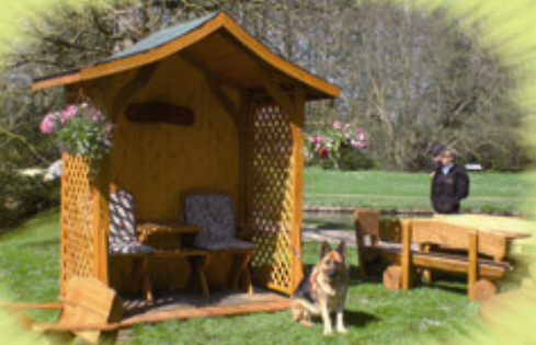
Neu! Sommerlaube „Erika“ komplett mit Bank: 1.800 Euro