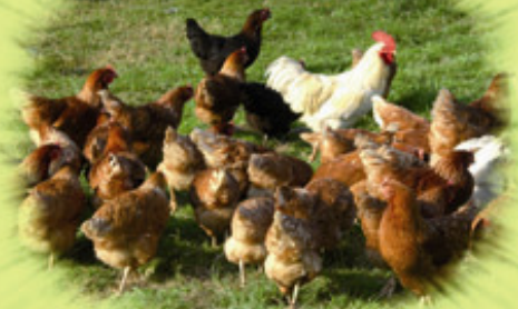
Eier von glücklichen Hühnern!