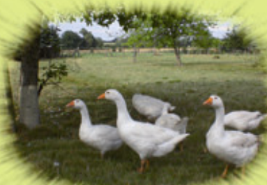
Enten und Gänse aus Freilandhaltung